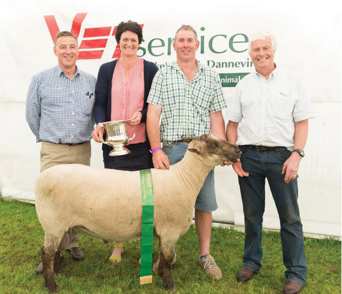
139/13 (pictured above) is the Supreme Champion Sheep of the Royal Hawke's Bay Show 2016 & 2017